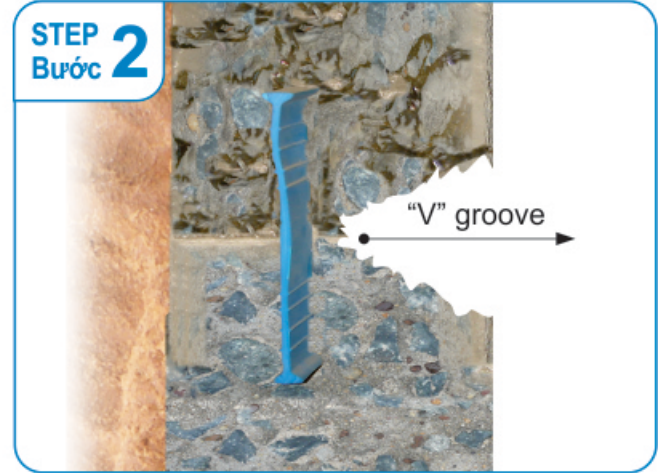
Chip off leakage point To form a "v" groove. Đục khu bị thấm, Tạo khe chữ "v" như hàm ếch.