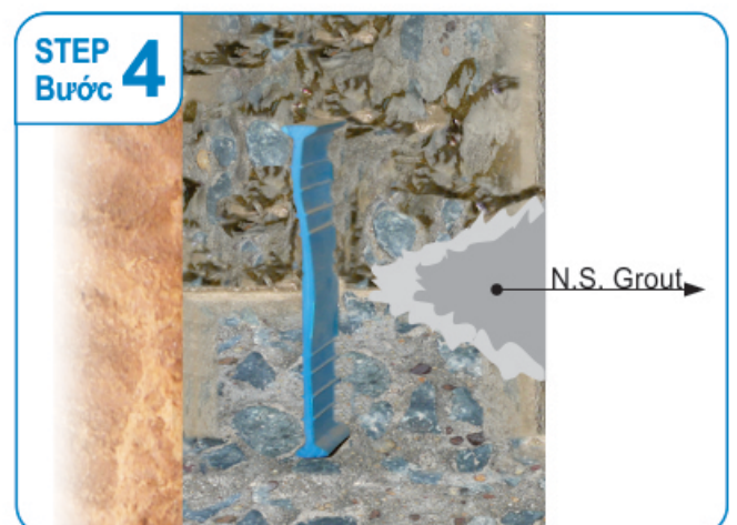
Fill the "v" groove by non shrink grout. Trám, và đầy khe chữ "v" bằng vữa không co ngót.