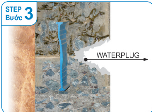
Plug the leakage by waterplug. Xử lý chống thấm bằng waterplug. (ximăng đông cứng nhanh trong vòng 10 giây)