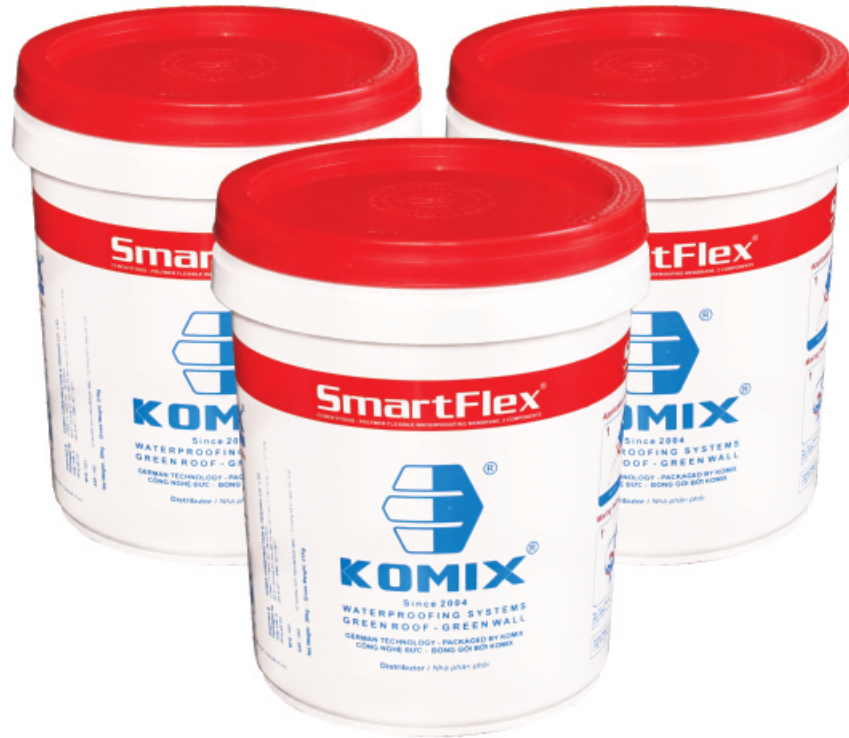
Product / sản phẩm: SMARTFLEX