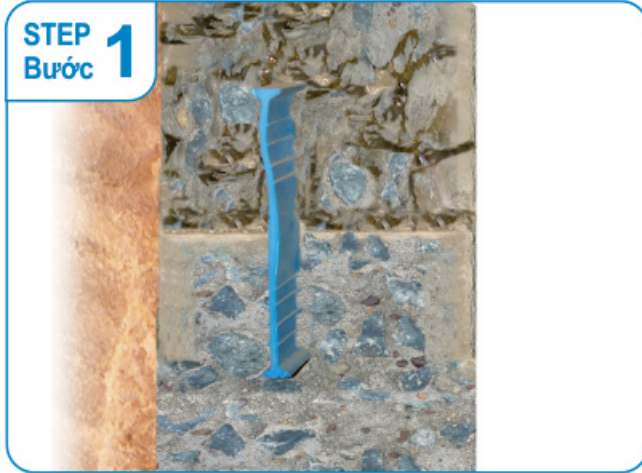
Construction joint of basement Mạch ngừng tường vây