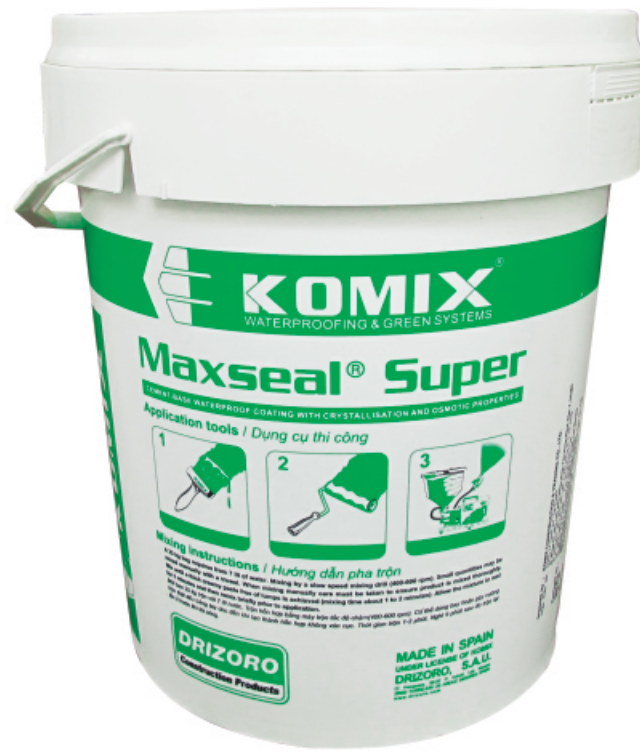
Product / sản phẩm: MAXSEAL SUPER